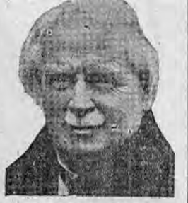
DAVID LLOYD GEORGE

LONDRES, 2 UP.—Al dirigir la palabra al consejo de la "acción en pro de la paz y de la reconstrucción", el ex-premier David Lloyd George dijo que los dictadores están triunfando sobre las democracias, declarando: "Siento mucho que en todas las crisis de los últimos años..."