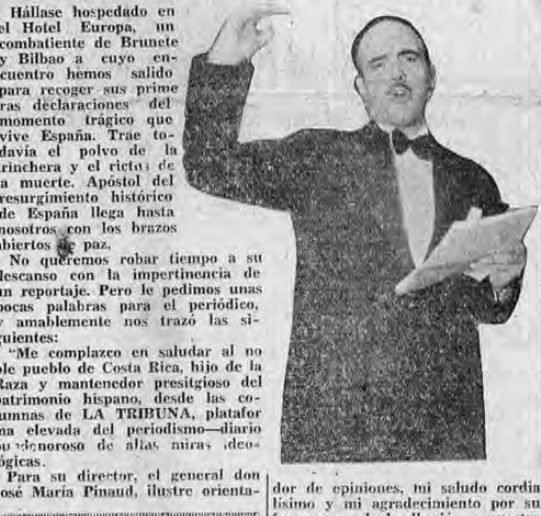
GINES DE ALBAREDA.